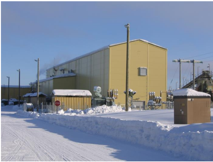
Anrikningsverket i Svartliden. Dragon Mining (Sweden) AB.