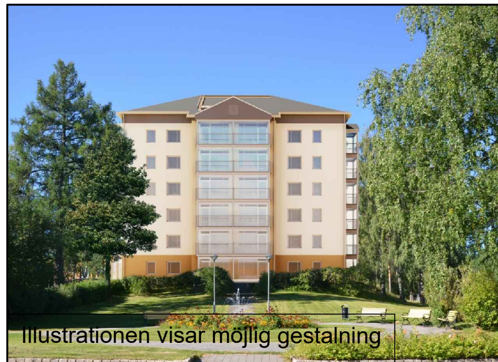
Illustrationen visar möjlig gestaltning

Koordinatsystem: Sweref 99 18 45 Grundkartan: 2021-06-25