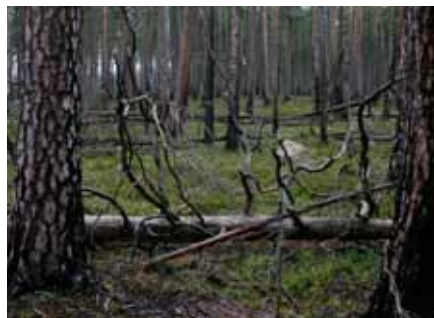
Brändpräglad tallskog på hedmark