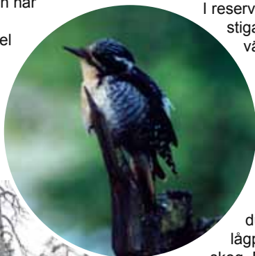
Tretåig hackspett »

Det lilla delområdet i söder utgörs av en liten högproduktiv fläck i en för övrigt lågproduktiv och hedartad skog. Detta beror på ett underjordiskt bäckdrag som rinner genom området. Granarna i området är imponerande stora men är trots detta inte äldre än 100-130 år. Intill reservatet finns lämningar av en kolmila, skjutbana och dansbana.