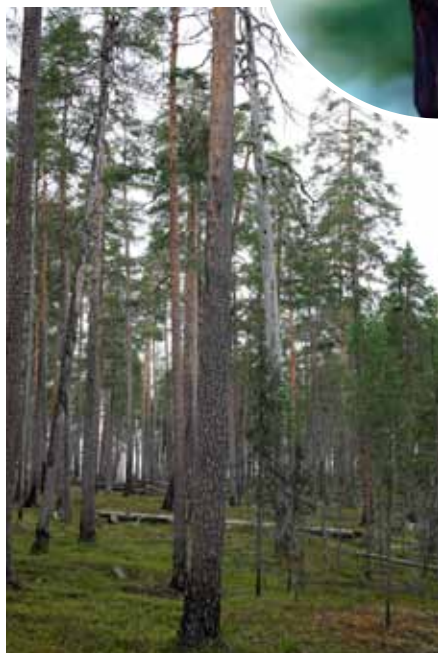
En torraka med många besök av hackspettar