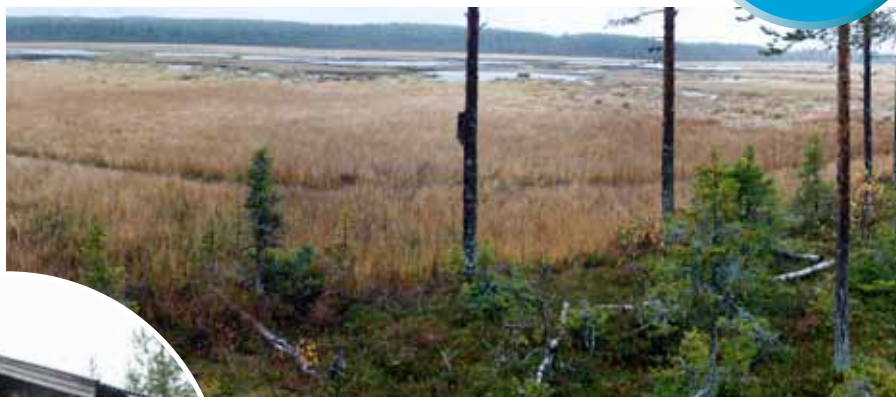
Sörmyran sedd från jaktkojans veranda

Dammen byggdes dock upp igen 2003 och våtmarken, på ca 40 hektar, räddades. Här och var finns små konstgjorda öar med lämpliga häckningsplatser för fåglar. Här finns en jaktkoja med en trevlig veranda som vätter ut mot myren. Det finns också ett vindskydd med eldstad.