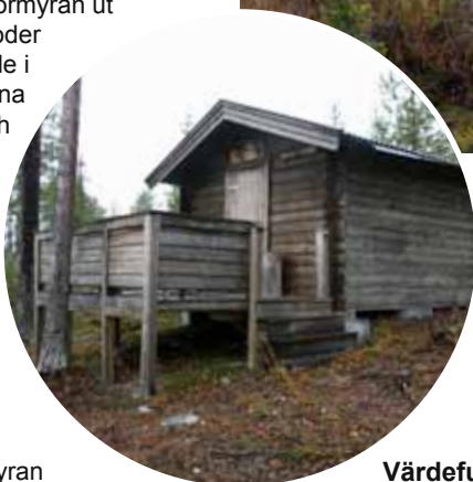
« Jaktkojan vid Sörmyran