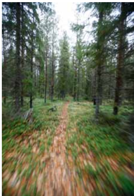
Stigen är snabb och lättvandrad.

Stigar: Stigen går över ett litet kalhygge innan skogen börjar. Väl snitslad, ca 600 m lång.