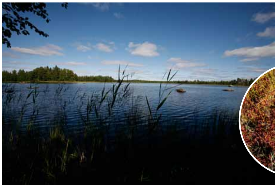
Bredselet, också en bra plats för fågelskådning