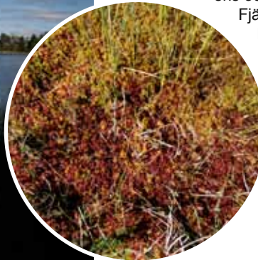
Starr och mossa

Fjäderdräkten är gråbrunstrimmig och ser man småspoven på nära håll har den en mörk hjässa med ett ljus hjässband. Vintertid återfinns småspoven huvudsakligen längs tropiska Västafrikas kuster.