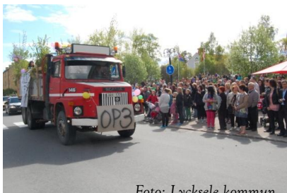
Högskolebehörig studentkortege 2012

Betygsresultaten för gymnasieskolan har ökat något i jämförelse med föregående läsår. Detsamma gäller andelen elever som är behöriga för högskolestudier.