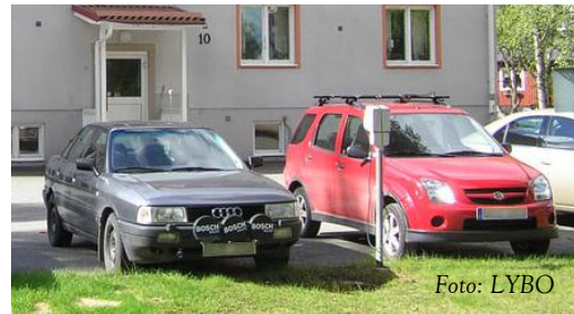
Motorvärmastyrning – ytterligare ett sätt för LYBO att spara energi

Genom sitt arbete med utgångspunkt från verksamhetssystemet bidrar LYBO till en hållbar utveckling. Här kan nämnas rutiner för inköp, upphandling, kemikalie- och avfallshantering m m.