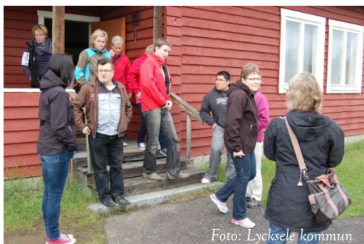
Nöjd och kompetent KS-personal släpps ut på grönbete, juni 2012

Tillväxtkontoret har under våren tillsammans med personalenheten planerat informationsträffar för nyanställda med första träffen i september 2012. Då ska nyanställda få praktisk och allmän information om Lycksele – en introduktion till hur det är att vara anställd och att bo i Lycksele.