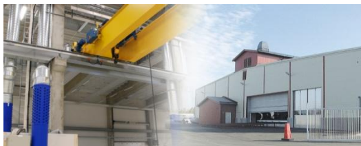
AB Lycksele Industrihus – indirekt drabbat av en konkurs!

kurs under sommaren, vilket innebär att prognosen för året uppgår till -0,7 mkr. Utan konkursen hade prognosen varit ett nollresultat.