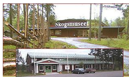
2,9 mkr har investerats i Skogsmuseet