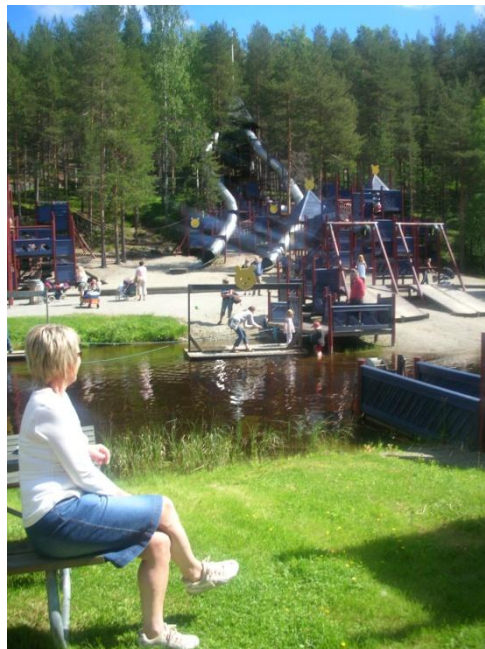
Sommar i Lycksele Djurpark!

Halvårssiffrorna pekar trots allt mot ett positivt resultat på ca 0,5 mkr. Intäkter och kostnader är hittills i linje med budget och förväntningar.