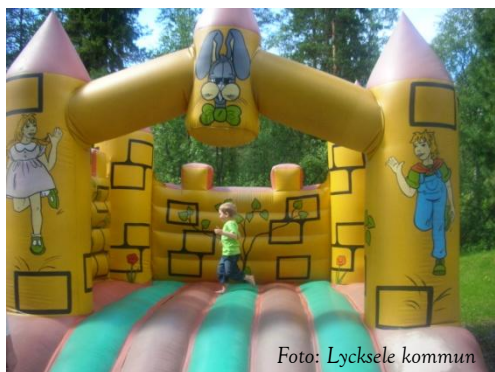
Lyckolandets hopptält – ett attraktivt utflyktsmål för unga hoppare!

park ett attraktivt utflyktsmål för kommunens egna invånare.