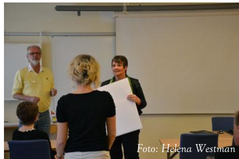
Det akademiska årets högtidliga avslutning 2012

Sedan 2002 har Lycksele lärcentrum efter behovsanalys rekryterat 221 studenter som genomfört programutbildningar i Lycksele. Av dessa har 199 (90 %) för utbildningsnivån adekvat arbete, och 93 av dessa bor och arbetar i Lycksele kommun. Ytterligare 57 bor och arbetar inom den övriga delen av Akademi Norr-området.