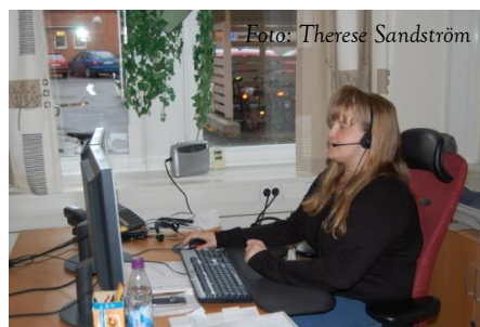
Kundtjänstjobb enligt ny telefonpolicy

Kundtjänsten har en egen länk på Lycksele kommuns hemsida. Storumans hemsida är under uppbyggnad. Två medarbetare har utsetts till webmasters i Storuman. Ny telefonpolicy är fastställd, och även lathund och råd finns tillgängliga. Sju utbildningstillfällen i triohänvisning har hållits, och även enskilda utbildningsinsatser har förekommit.