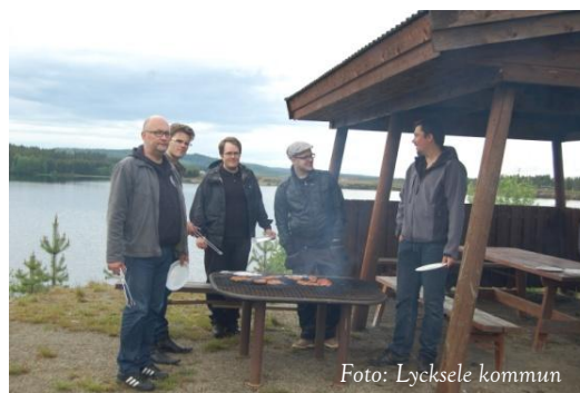
Kommunstyrelsens förvaltning grillas i konsten att grilla!

Arbetet med lösningsspåret om jämn arbetsfördelning har ännu inte påbörjats.