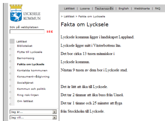
Lättläst om Lycksele på hemsidan

heten till informationen på hemsidan. Ny information översatt till syd-, nord- och umesamiska har lagts in, och layouten har ändrats för att vara mer tillgänglig för funktionsnedsatta. Lansering av den nya layouten görs under hösten.