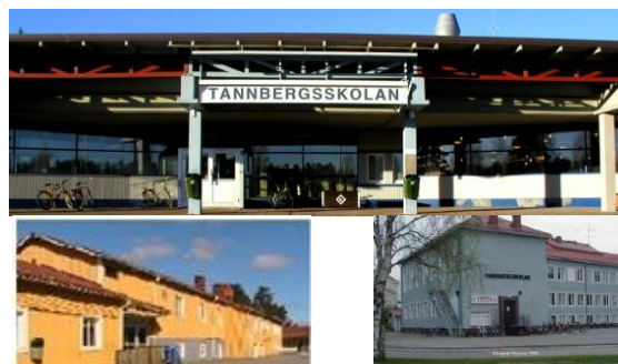
Underskott bärs upp av överskott

tet kommer från detta. Bland de egentliga verksamhetsbudgetarna prognostiseras underskott för gymnasieskolan med nästan 4 mkr. Detta vägs dock upp av motsvarande överskott inom andra delar av för- och grundskola.