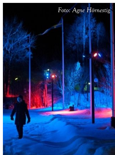
Väl upplyst stadspark med hjälp av ljusinstallationen "Renens fjäll"