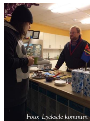
Samisk närvaro på Finnbacksskolan