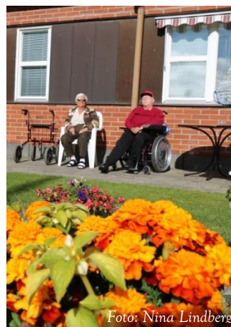
Vård- och boendebehov tillgodosedda på Skyttens äldreboende