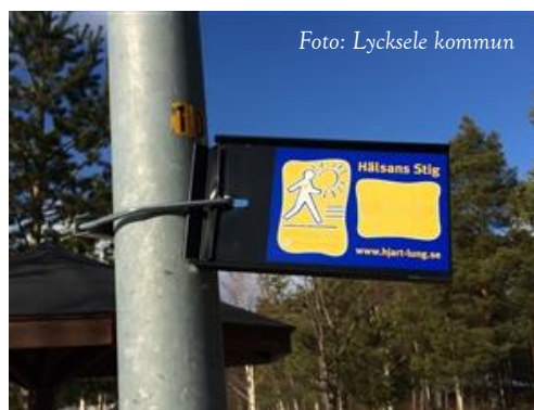
En vägledning till Hälsans Stig!