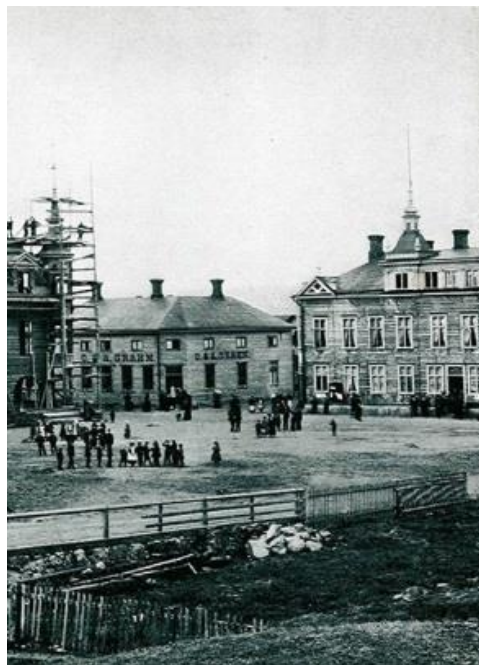
Torget i Lycksele – före "förändringarnas tid"!