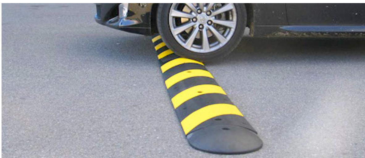
Hinder för att begränsa fordons (fram)far!

Kommentar: Neddragning i budget inför 2016 för belysningsunderhåll innebär en minskning av löpande underhåll och lampbyten.