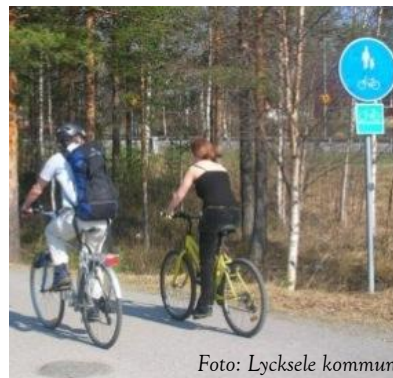
GCvägar – en infrastrukturell satsning för icke-bilburna trafikanter!