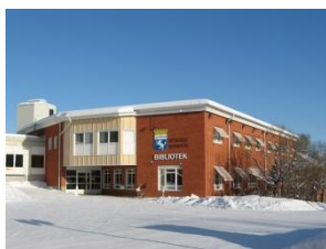
Kultur & utbildning har uppnått större kostnadseffektivitet!

Kostnämnden samt Lycksele Kost gör ett betydande underskott, som sammantaget uppgår till strax under 3 mkr. Orsaken är att verksamheten inte anpassats till de efterfrågade måltidsvolymerna som gäller nu.