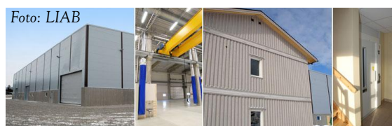
Industrihusbolaget undgick befarad kundförlust!

AB Lycksele Industrihus redovisar en prognos som pekar mot 0,1 mkr. Den befarade kundförlust som var upptagen i budgeten kommer att utebli. I övrigt följer prognosen budget. Det finns i nuläget inga större osäkerhetsfaktorer i prognosen.