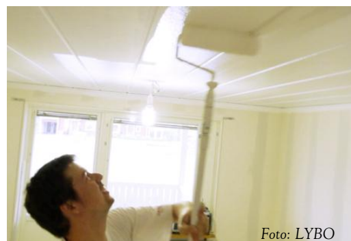
Ökade underhållkostnader för LYBO!

Då placeringsportföljen består nästan helt och hållet av värdepapper som klassificeras som räntebärande blir värdeökningen begränsad.