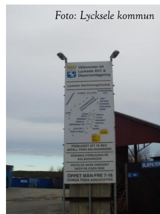
ÅVC – ett centrum för återvinning och källsortering!