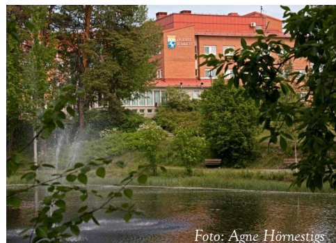
Lycksele Stadshus bakom prunkande sommargrönska

Lycksele Stadshus AB och Hedlunda Fastigheter KB visar tillsammans ett prognostiserat nollresultat.