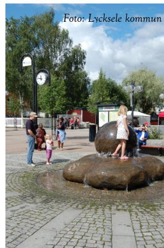
Trygg och offentlig lyckselemiljö!