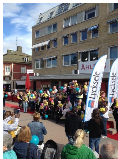
Man ska underlätta för föräldrar att dela på ansvaret för sina Guldungar!