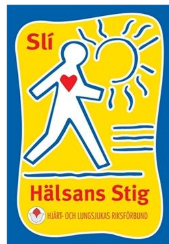
Hälsans Stig – en friskare väg att vandra!