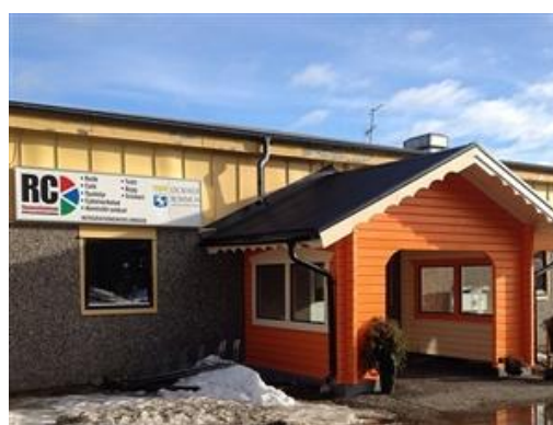
Puls – ett bolag under avveckling!

Puls i Lycksele AB förvärvades av Lycksele Stadshus AB i januari 2014. Företaget är under avveckling och visar ett prognostiserat nollresultat.