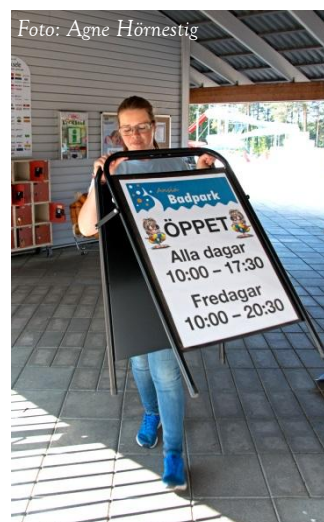
Solen har tyvärr lyst med sin frånvaro för Ansia Badpark!

Servicenämnden och planeringsenheten verkar gå mot ett underskott på ca 600 tkr. I halvårsuppföljningen ser det ut att fattas intäkter. Orsaken är troligen att utförda tjänster i verksamheten inte är fakturerade under första delen av året. Faktureringar utreds av förvaltningen och av ekonomienheten i syfte att komma i balans med intäkterna.