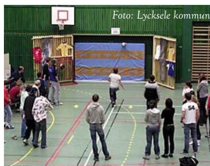
Fritidsaktivitetslokal med högt bokningstryck - Tannbergshallen

Fritidsenheten fortsätter sin utveckling av förenings-tjänster via Internet, vilket innebär 24-timmars tillgänglighet för t ex ansökan om föreningsbidrag och bokningsförfrågan för fritidsanläggningar. Genom samverkan med Kundtjänst har telefon- och besökstiderna för lokalbokningsfunktionen utökats till 8 timmar per dag.