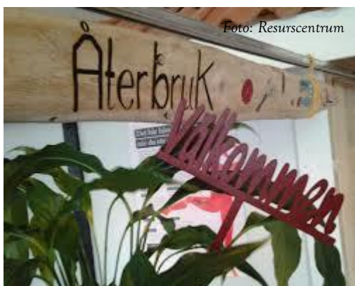
Återbruk – av gammalt görs nytt!

Arbetsmarknadsenheten/Resurscentrum har under perioden i samarbete med AVA fortsatt att utveckla ett Återbruk i syfte att skapa meningsfull sysselsättning till medborgare med rehabiliteringsbehov och som befinner sig utanför arbetsmarknaden. Syftet är också att ta till vara och återvinna avfall och därmed minska negativ påverkan på miljön.