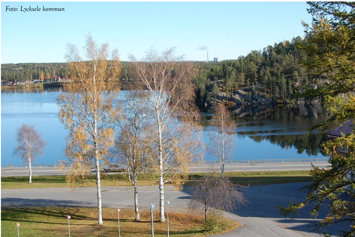
I väntan på vinter och årsredovisning för 2014!