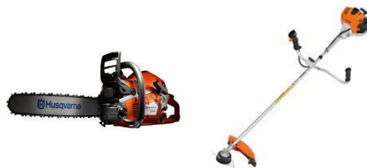
Motorsåg resp. röjsåg – redskap som numera kräver förarbevis och därmed utbildning

Inom samhällsbyggnadsförvaltningen har det genomförts utbildningar i arbetsmiljö och förarbevis.