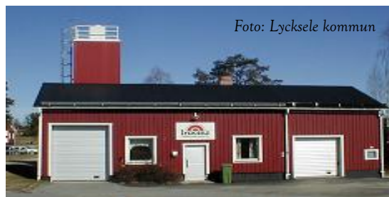
Vattenverket i Lycksele – centrum för en taxefinansierad service

Serviceämnden redovisar ett prognostiserat underskott med 0,5 mkr jämfört med budget. Detta beror dels på lägre intäkter vid skogsavverkning (-0,3 mkr), dels på extra kostnader för detaljplaner. Per den 31 augusti är förbrukningen 59,3 %, vilket är under riktmärket på ca 66 %. Bland serviceämndens resultatenheter prognostiserar Bredband ett överskott med 0,5 mkr för 2014, vilket främst beror på intäkter för anslutningar. Övriga resultatenheter prognostiserar ett nollresultat. De kommersiella delarna inom avfallshanteringen beräknas ge ett litet plusresultat. De taxefinansierade delarna kommer få ett minusresultat, som täcks av taxeeöverskotten från tidigare år.