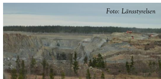
Gruvdrift – en avvägning mellan arbetstillfällen och miljömässiga hänsyn

Miljö- och samhällsförvaltningen ska i sitt arbete öka kommuninvånarnas och företagets medvetenhet om sin miljömässiga påverkan.