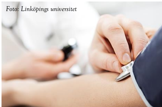
Specialistsköterskeutbildningar är till stor del nätburna – en fördel för den som bor i glesare bygd!