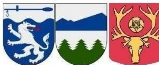
Fr o m 1 januari 2014 är även kundtjänsten i Åsele en del av LYST-samarbetet

En översyn av kundtjänsten i respektive kommun i syfte att skapa lika tillgänglighet för alla och att aktivt arbeta med förbättringsåtgärder. Perspektivet jämställdhet och mångfald ska användas vid rekrytering.