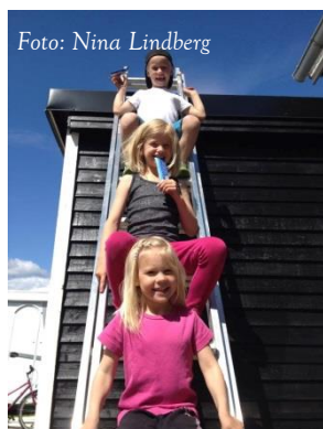
Kultur- och utbildningsförvaltningen bedriver ett arbete som stegvis ska leda till jämställdhet

Enligt nationella styrdokument är förskolans och skolans uppdrag att se till att alla barn och elever, oavsett könstillhörighet, får pröva och utveckla sina förmågor och sina intressen. Jämställdhetsarbetet handlar både om sociala relationer och om perspektiv på undervisningen och ämnesdidaktiken. Det handlar både om de föreställningar vi är bärare av, om kommunikation, om jämställdhet som kunskap i sig och om jämställdhetsperspektiv i alla skolans ämnen. Arbete med jämställdhet har ett värde i sig utifrån förskolans och skolans värdegrund och demokratiuppdrag, men det är också en förutsättning för att lyckas med kunskapsuppdraget. Ett fortsatt prioriterat förbättringsområde är att höja pojkarnas kunskapsresultat.