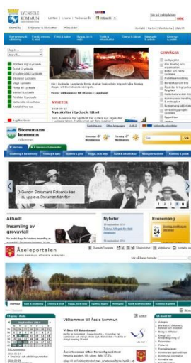
De tre LYST-kommunernas hemsidor – föremål för fort-löpande uppdatering!

Ett annat strävande är att i kunskapsöverförande syfte utöka möjligheterna för Kundtjänst att göra vissa uppdateringar på kommunernas hemsidor.