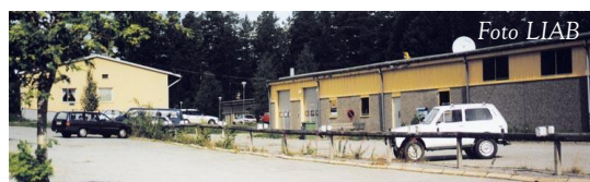
Städet 4 har fått ett rejält "marklyft"!

För att öka tillgängligheten till Städet 4 har marken utanför entrén åtgärdats.