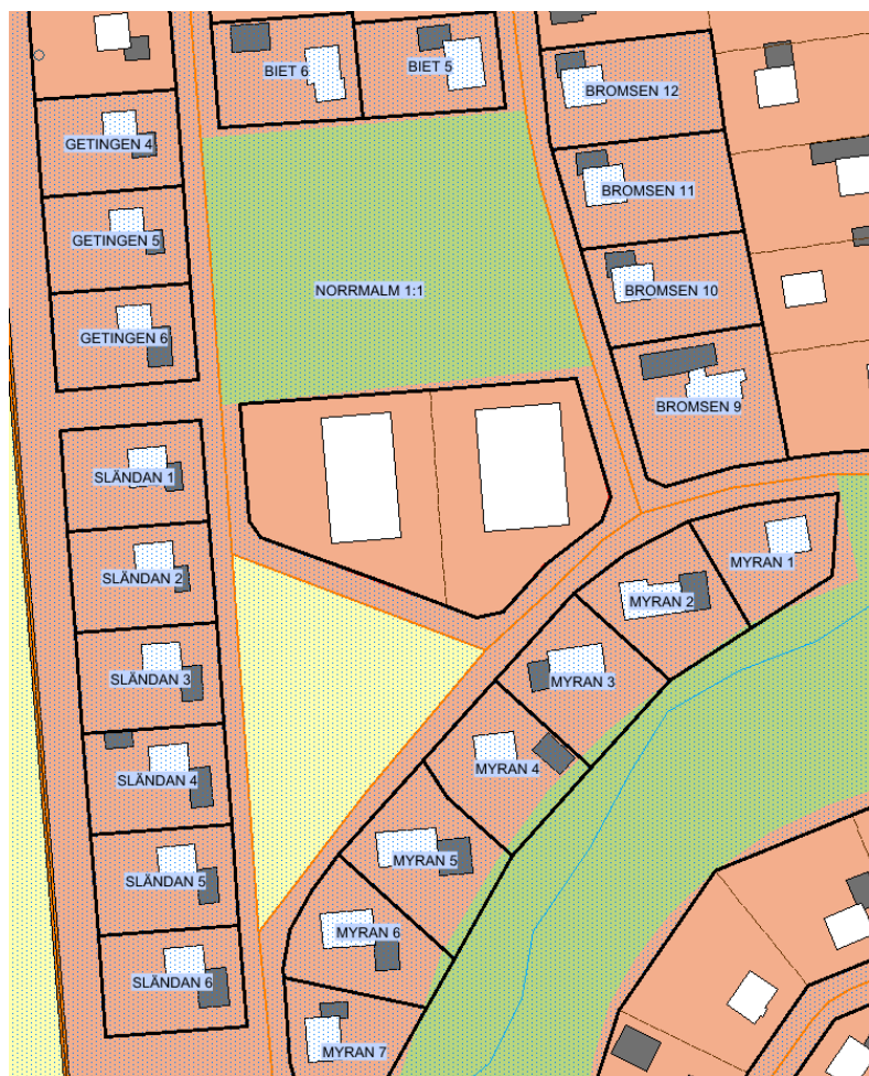
Figur 2 - Sakägarkrets: fastigheter utanför och i anslutning till planområdet.