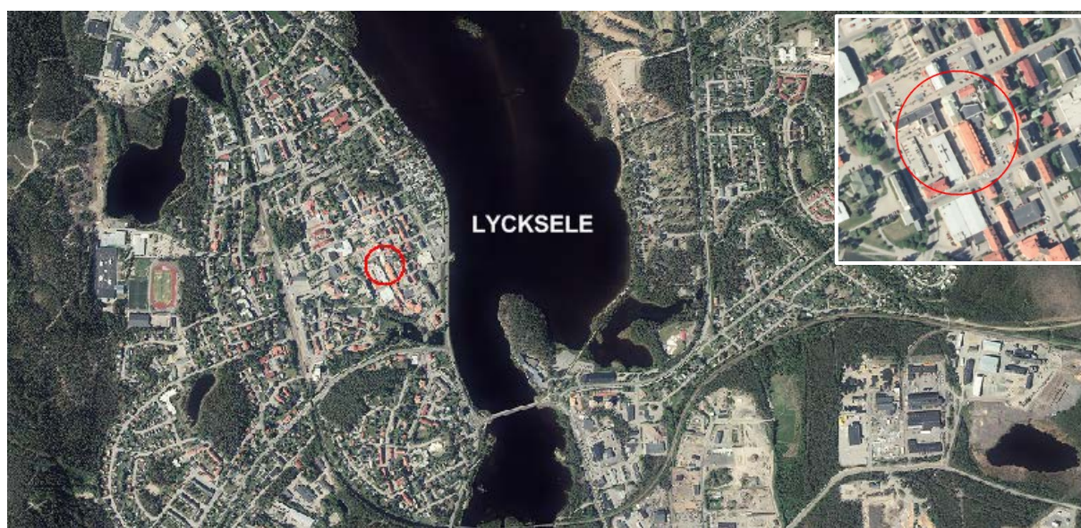
Figur 1 - Planområdets ungefärliga läge inom Lycksele tätort