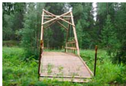
Bro över Vänjaurbäcken

Vid Vänjaurbäcken går leden både över myrar och längs skogsbilvägar. Något svårnavigerat för den oinvidde. Över bäcken finns en nybyggd rejäl bro. Här kan man stanna och studera den friska örtvegetationen längs bäcken, med arter som nordisk stormhatt, älgört och slätterblommor