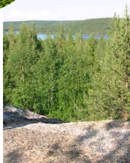
Utsikt över Stor-Tanträsket från hälla vid Kvarnberget