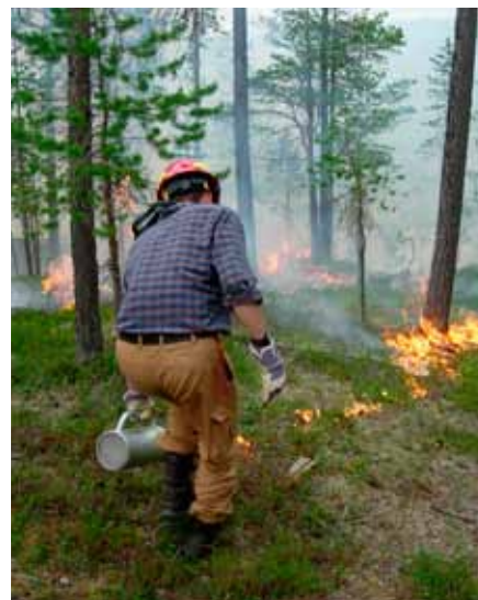
Naturvårdsbränning i Bocksbergets reservat

I närheten av Bocksliden går det bra att fiska och här finns bland annat gädda, abborre och öring. I sjöarna gäller Sverigefiskekortet. Mellan Bockslidenområdet och Bocksbergets norra del går en stig på ca 2 km. Den är inte så väl använd och kan vara svår att hitta. Överbo naturreservat vid E 12 vid Vilan, knappt tre km från slalombacken, är ett lättillgängligt naturskogsreservat med fin promenadstig.