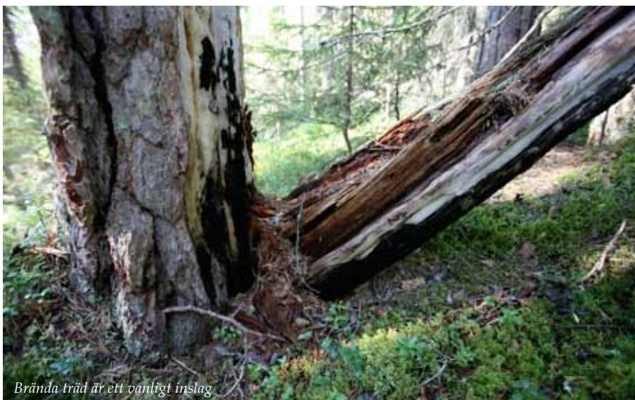
Brända träd är ett vanligt inslag

Tallen finns i hela landet och var ett av de första träd som invandrade till Sverige söderifrån efter den senaste istiden. Träden växer mest på torra marker som hällmarker, sandmark och hedar.