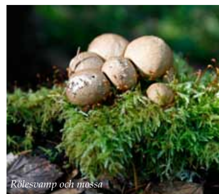
Rölesvamp och mossa

översidan och den ljus ockrafärgade undersidan. Svampen växer oftast på nedfallna döda granar i orörda barrskogar. Andra spännande arter är skinnlav, violmussling, rynkskinn, rosenticka men även stuplav, dvärgbägarlav, tallticka och kötticka.