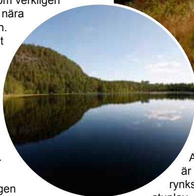
Vy över Bocksliden

Inte långt utanför Lycksele ligger Bocks-liden som är ett stadsnära och vackert skogsområde. Landskapet är mycket kuperat med höga berg och djupa sjöar. Här finns förutom Bocksliden också Trollberget, Tjäderberget och Vinberget. En av naturskogarna som verkligen är värd ett besök ligger nära vägen vid slalombacken. För att komma hit är det lättast att man parkerar på mötesplatsen som ligger cirka 150 meter efter slalombackens parkering och tar direkt ner till vänster mot skogen. Här öppnar sig en riktig skogspärta med en stor andel gran men även tall, asp och björk. Skogen är gammal och det finns gott om fallna träd, olika vedartade svampar och lavar.