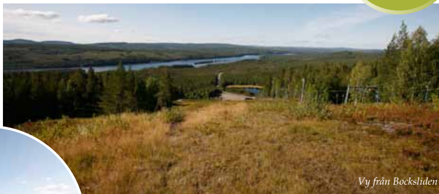
Vy från Bocksliden

översidan och den ljus ockrafärgade undersidan. Svampen växer oftast på nedfallna döda granar i orörda barrskogar. Andra spännande arter är skinnlav, violmussling, rynkskinn, rosenticka men även stuplav, dvärgbägarlav, tallticka och kötticka.