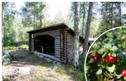
Rastkoja vid Bockstjärn

Det mindre området har naturvårdsbränts år 2005 och 2009. Det görs för att gynna arter som är beroende av brand och för att få en flerskiktad skog. Det är intressant att jämföra och till exempel se hur snabbt vegetationen återkommer efter branden.