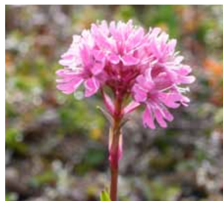
Fjällnejlika, växer bland hållarna mot älven

Vill man göra en lite längre skogspromenad i anslutning till ett besök vid Bålforsen så kan Grävetjärnsberget i Lyckans Fritidsområde, ca 9 km österut rekommenderas.