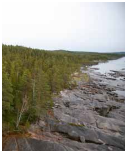
Utsikt från dammen