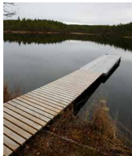
Brygga vid Djupavatjärn